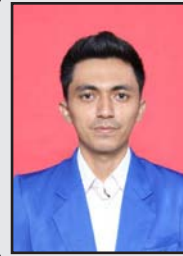
OCEP TRIAL, S.Ak 20160102304